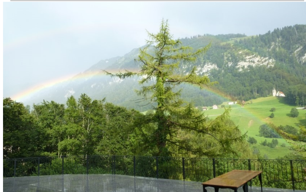
von der Wallfahrt nach Flüeli in der Schweiz Zu Bruder Klaus und seiner Frau Dorothee (Namenstag: 25. September)

Der Regenbogen— von Gott schon bei Noah gesetzt: Bundeszeichen mit den Menschen—: In Jesus Christus wird es endgültig!