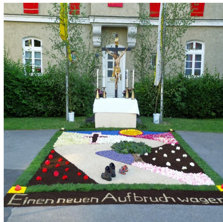
Fronleichnam 2017 am Pfarrhof